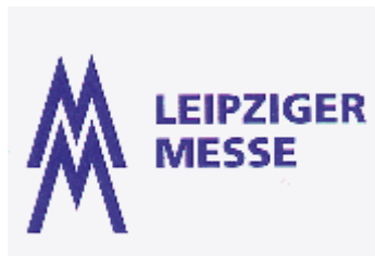
Abb.3: Logo B