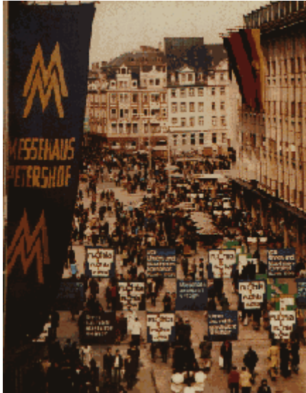
Abb.10: Messehäuser um 1980