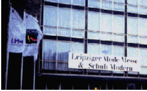
Abb.12: Mode- und Schuhmesse 1992