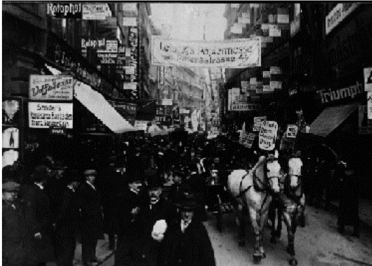
Abb.4: Papiermesse 1910