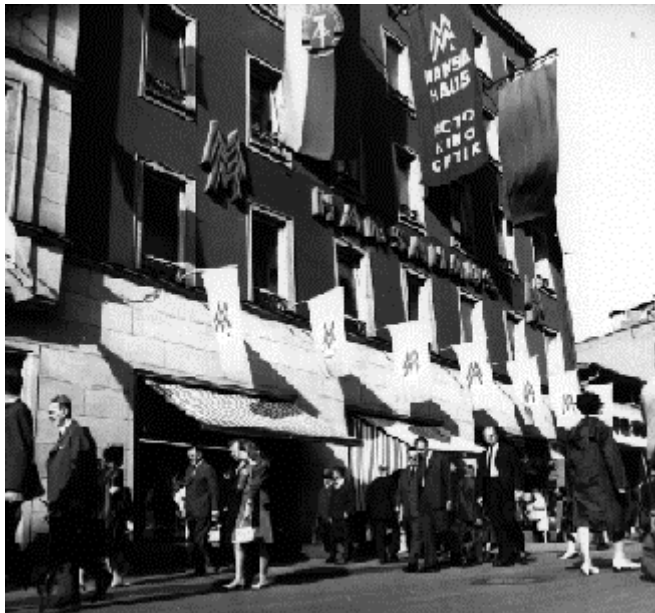
Abb. 9: Messehaus 1967

Für die Messehäuser wurden ebenfalls Flaggen eingeführt. Ihre Farbgebung ist umgekehrt: blaues Tuch mit gelber Aufschrift. In den 50-iger Jahren wurde folgende Variante verwendet: dreimal Doppel MM über dem Namen des Messehauses. In den 60-igern Doppel-MM über dem Namen und der ausgestellten Branche (z.B. Foto Kino Optik, Abb.9). Ende der 70-iger und in den 80-igern nur das Doppel-MM über dem Namen des Messehauses (Abb. 10). Zusätzlich wehten als allgemeine Beflaggung die DDR-Staatsflagge und die Rote Fahne der Arbeiterklasse. Zur 800 Jahr Feier der Stadt Leipzig und ihrer Messe hingen überall blau-gelb gestreifte mit dem weißen Jubiläumseblem versehene Flaggen ( Abb.11). Seit 1991 werden bei jeder Einzelmesse eigene Flaggen mit dem jeweiligen Messelogo (z.B. Automobil-, Schuhmesse usw.) gezeigt (Abb. 12). Die Messehäuser werden seit 1991 aufgegeben und haben deshalb keine Flaggen mehr.