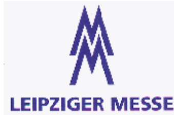
Abb.2: Logo A

Das Emblem wurde mehrfach modifiziert. Zum Teil waren mehrere Varianten gleichzeitig in Gebrauch. Bestimmte Formen wurden nur auf Plakaten verwendet. Seit Anfang der 80-iger Jahre blieb das Doppel M unverändert. Heute ist der Gebrauch des Emblems im Corporate Design Manual von 1996 geregelt. Neben dem Doppel M steht Leipziger Messe (Version A und B) im Schrifttyp Frutiger Black (Abb. 2 und 3).