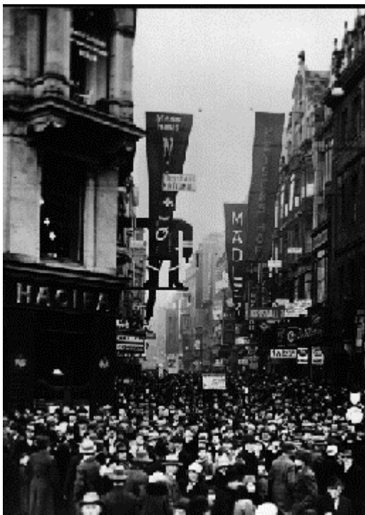
Abb.5: Messehäuser ca. 1930

Die möglicherweise erste Messeflagge stammt von 1928. Sie wehte am Ringmessehaus, wo Textilien ausgestellt wurden (Abb. 6).