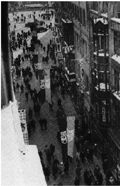
Abb.11: 800- Jahrfeier 1965