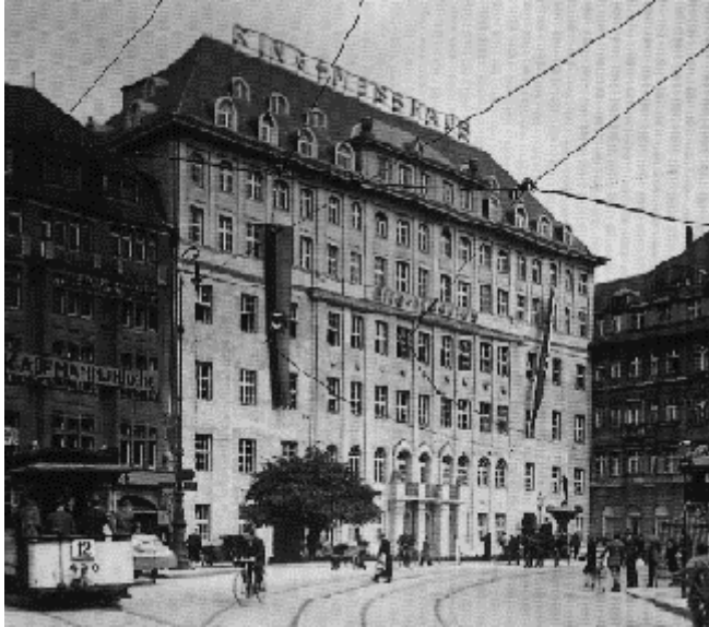
Abb.6: fragliche 1. Messeflagge 1928

Zwischen den beiden Weltkriegen begann man die Flaggen der teilnehmenden Länder zu hissen. 1935 wehte die Hakenkreuzfahne noch zwischen den anderen Flaggen. Nach 1941 sieht man nur noch das Hakenkreuz. 1944 wurden alle Messeaktivitäten in Deutschland eingestellt. Der Neubeginn war 1946. Selbstverständlich wehten jetzt die Flaggen der Siegermächte sowie Sachsens und Leipzigs. Anfang 1950 wurde die Messeflagge eingeführt: gelb mit einem blauen Doppel MM in Anlehnung an das Blaugelb der Leipziger Stadtflagge. Die offiziellen Farbbezeichnungen sind: Leipziger Messeblau (HKS 42) und Leipziger Messegelb (HKS 5). Die Maße sind etwa 3:1. Die Größe des Emblems ist ungefähr 0.8 in der Mitte der Flagge. In den 70-iger Jahren